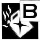
Brandklasse B - Flüssigkeitsbrände

Bei Bränden von Flüssigkeiten (Benzin, Alkohol, Öl, usw.) kein Wasser einsetzen, da diese Flüssigkeiten aufschwimmen können und dadurch der Brandherd vergrößert wird. Vorwiegend Pulverlöscher der Klassen ABC oder BC oder Schaumlöscher einsetzen.